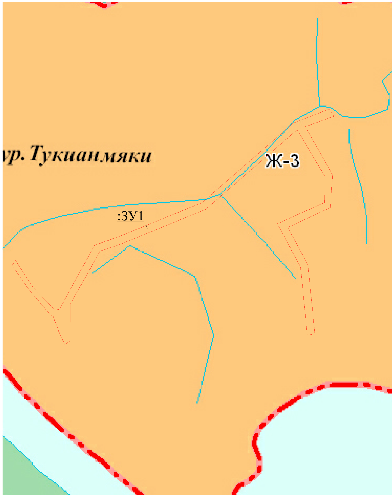
Схема расположения земельного участка на карте градостроительного зонирования (Сортавальское городское поселение)